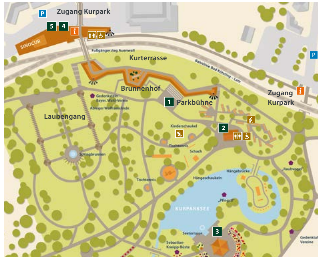
Gestaltung: LABOR 2 - Designagentur | Christian Vill | Bad Kötzing